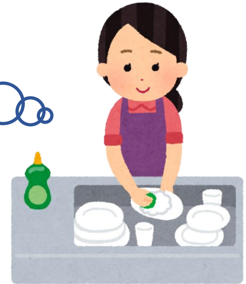
よみうり 花子さん