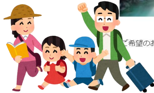
草津温泉・湯畑 ご希望のお客様は、湯煙漂う草津温泉・湯畑散策もお楽しみ（各自ホテルからバス移動）